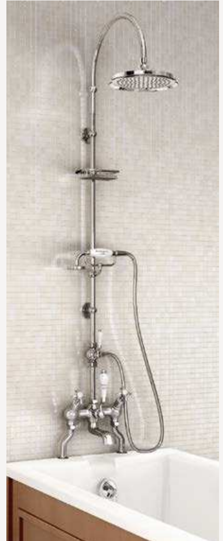
Смеситель "под наклоном" на ванну, вертикальная стойка с изогнутым держателем для душа, душевая насадка 228,6 мм, металлическая мыльница-решетка, дивертер и подставка для ручного душа