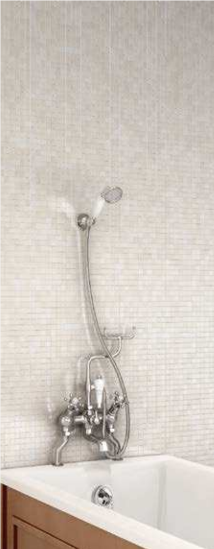
Смеситель "под наклоном" на ванну, держатель для ручного душа